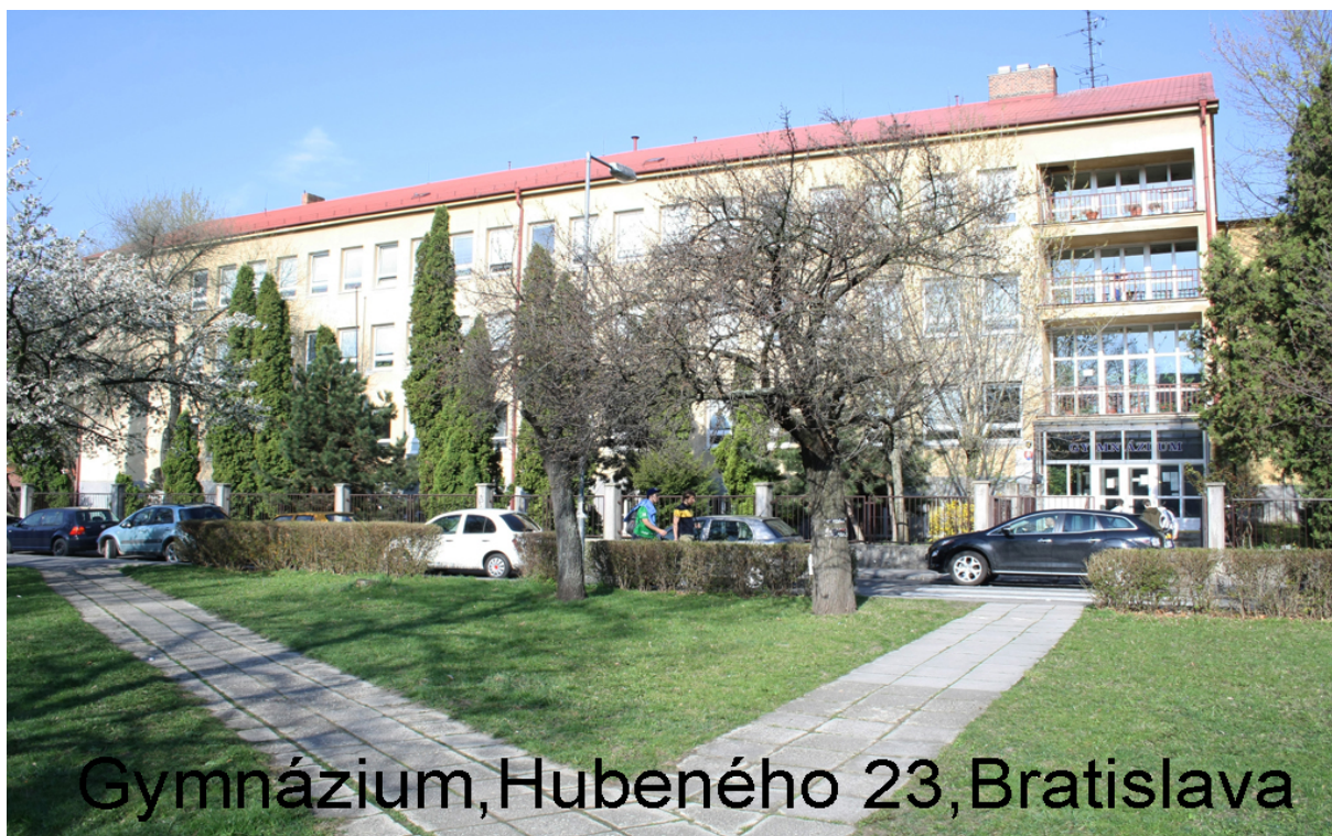
Gymnázium, Hubeného 23, Bratislava