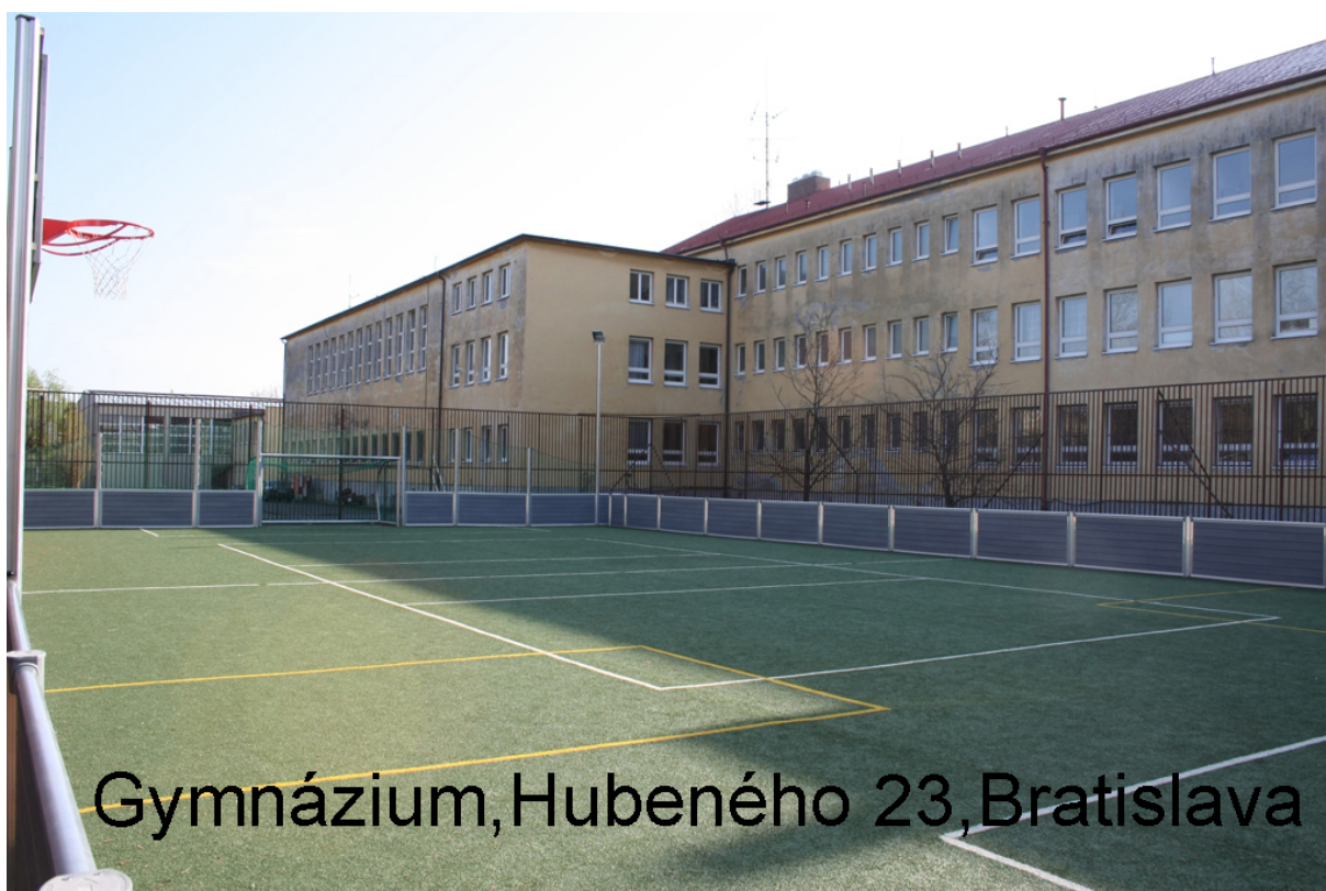
Gymnázium, Hubeného 23, Bratislava