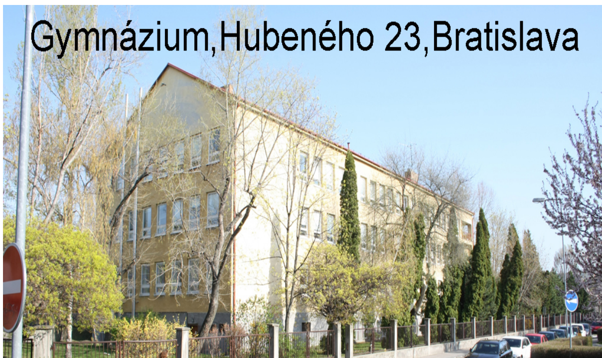
Gymnázium, Hubeného 23, Bratislava